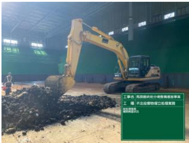
展開検査状況（管理型混合廃棄物）