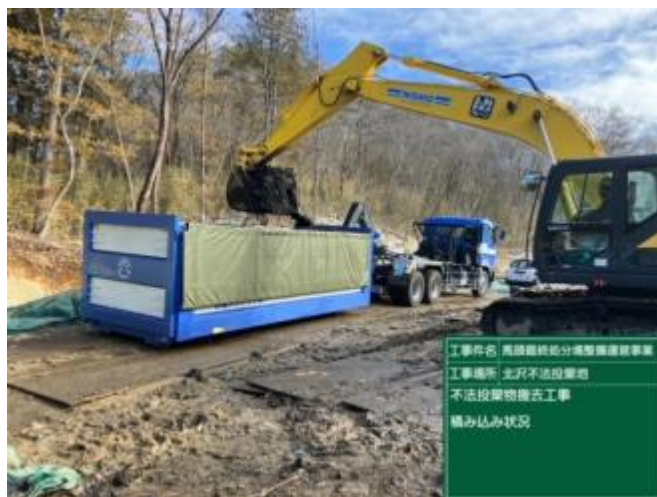
不法投棄物積み込み状況