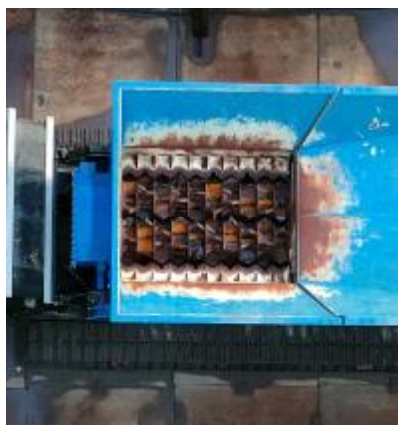
破碎機（不法投棄物を埋立するため細かくします）