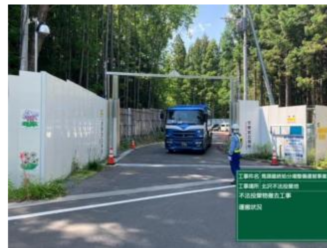
不法投棄物運搬状況