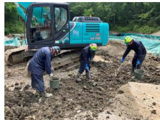
不法投棄地における選別状況