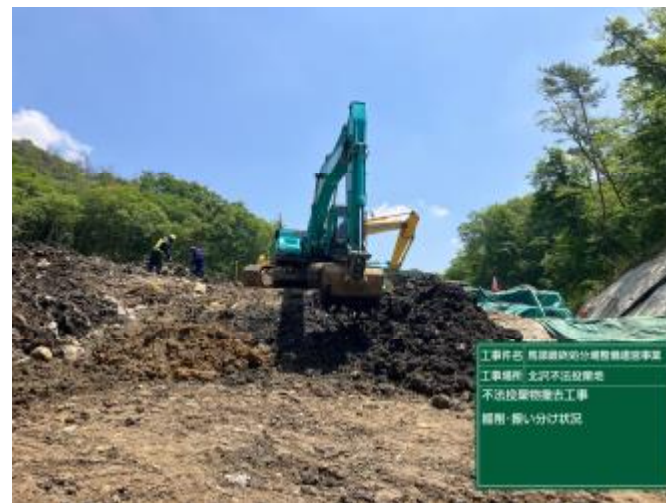
掘削・ふるい分け状況