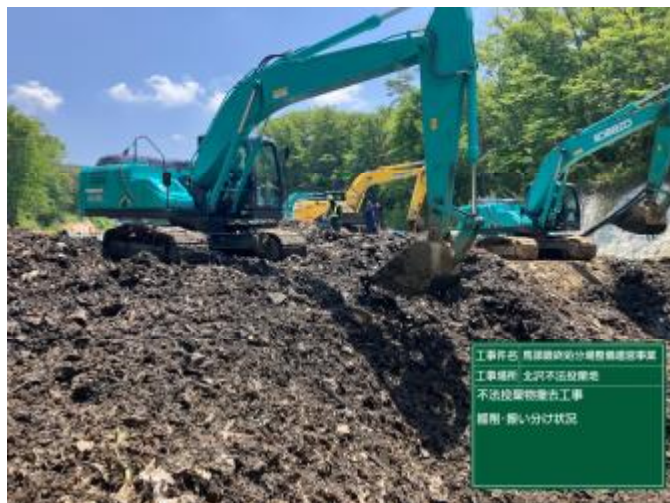
掘削・ふるい分け状況