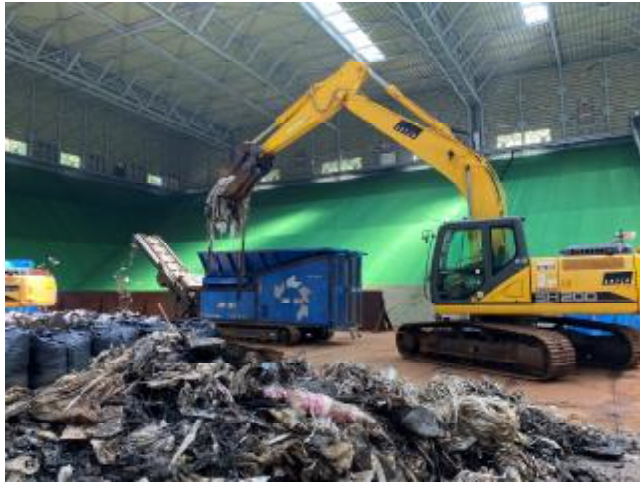
破碎機投入状況（廃プラスチック）